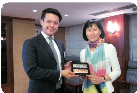
12月1日：午餐講座－「抑鬱症與法律界」