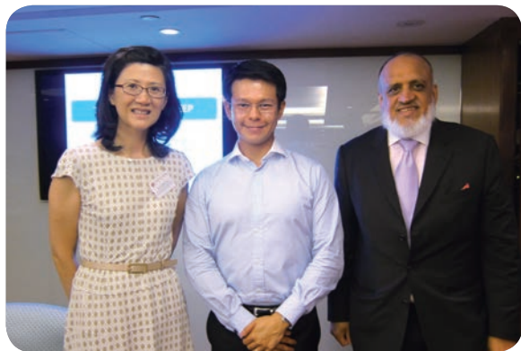
6月23日：午餐講座－「改善睡眠質素小貼士」