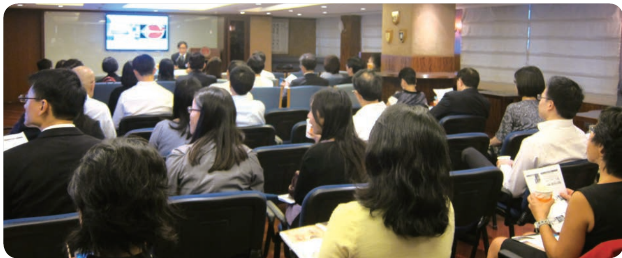
9月22日：「眼睛護理」午餐講座