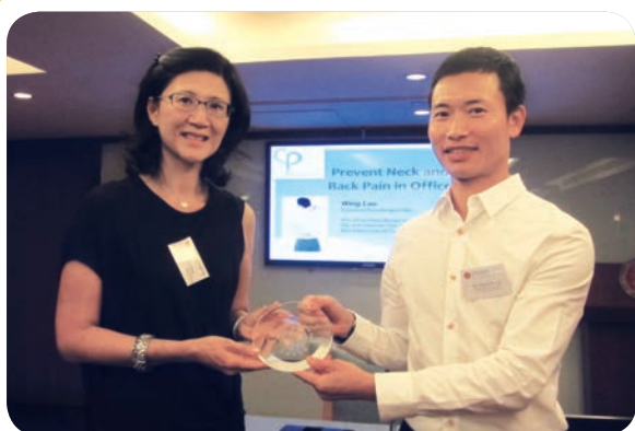
10月9日：午餐講座－「預防因工作引致的頸背痛」