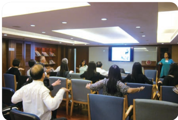
4月16日：「辦公室瑜伽體驗班」

會員身心康健計劃工作小組於2013年10月成立，負責籌辦和推出各類短期和長期的身心康健項目和活動，藉以促進廣大會員的身心健康。工作小組探討會員在管理壓力及處理精神和情緒問題方面的能力和情況，找出他們的需要和關注，以及為有需要尋求協助的會員安排提供適當服務及／或資訊。工作小組於年內舉辦下列活動：