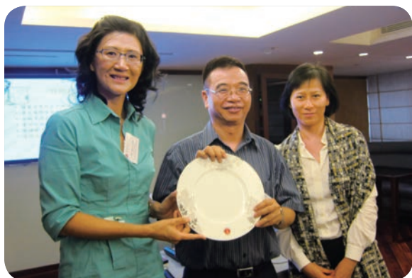
10月7日：午餐講座－「認識精神健康急救及其對於嚴重抑鬱症的應用」