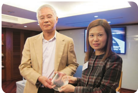
11月28日：「香港最常見癌症」黃昏講座