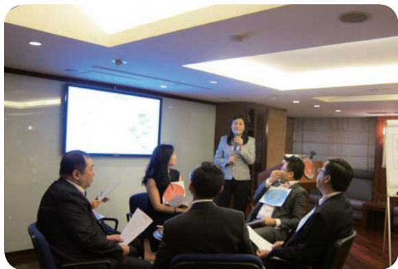
11月27日：「中國茗茶文化及禮儀」午餐講座