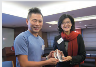
12月2日：會員身心康健計劃一「半小時講座、半小時瑜伽」