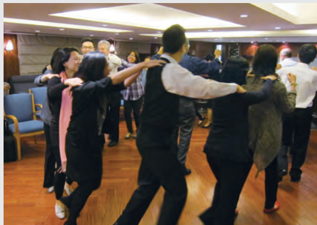
11月21日：會員身心康健計劃一「愛笑瑜伽體驗班」