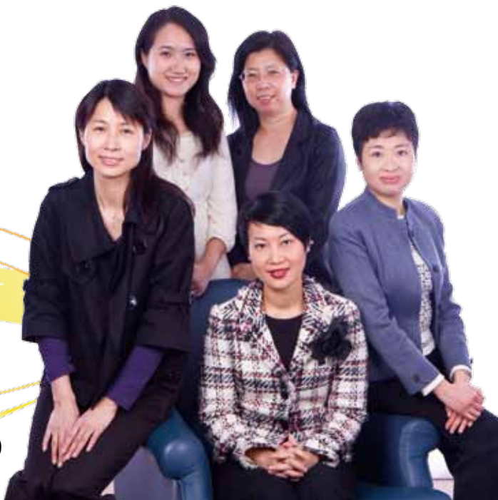
專業水準及發展部