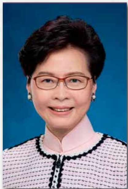
香港特別行政區行政長官 林鄭月娥女士，大紫荊勳賢，GBS題辭