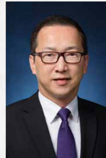
袁民忠先生, JP 香港特別行政區政府政制及內地事務局 主任（特別職務）

袁民忠先生畢業於香港大學。他在1985年加入香港政府任職政務主任，曾在多個政策局及部門工作，包括房屋署、前經濟科及行政科、香港駐華盛頓經濟貿易辦事處、財經事務及庫務局、發展局、駐北京辦事處和政府產業署。他由2015年起擔任政府產業署署長，歷時3年，並於2019年1月加入政制及內地事務局，負責統籌帶領粵港澳大灣區發展辦公室推行有關的工作。